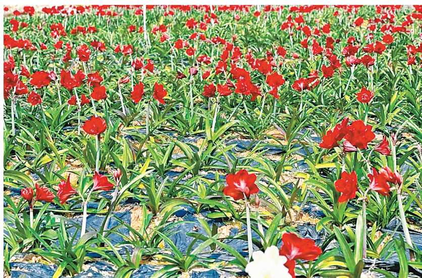
石牛村创新“朱顶红+蔬菜”轮作模式,盘活闲置土地,带动村集体和农户增收致富

阔,每亩年产量5000斤,年产值可达1.5万元以上,极大提振了村民种植的积极性。“以前这片地杂草丛生,现在种上