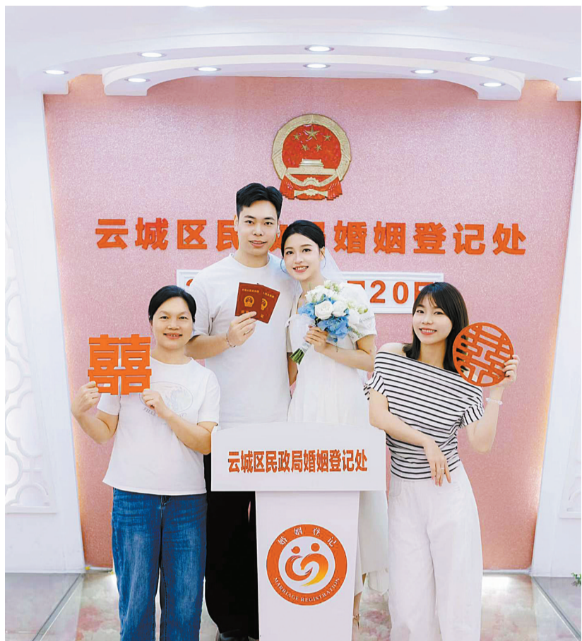
云城区民政局婚姻登记处，新人甜蜜领证，现场爱意浓浓，幸福洋溢。

从“多地跑”到“全国通办”，从“材料繁琐”到“一证通行”，从“行政确认”到“幸福体验”，云浮正用速度与温度，让颁证成为每对新人幸福旅程的起点。