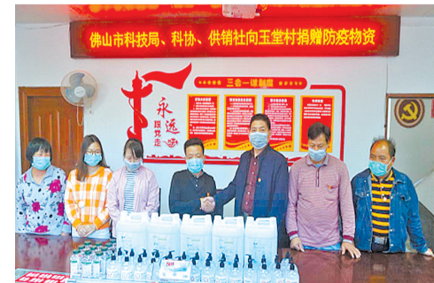
佛山市科技局、科协、供销社等单位向玉堂村捐赠防疫物资

9月，佛山市科技局联合佛山市第一人民医院继续向通门镇中心小学捐赠10箱免洗手液，帮助孩子们养成勤洗手讲卫生的好习惯。