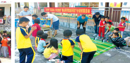
冲枝小学学生参与足球机器人比赛