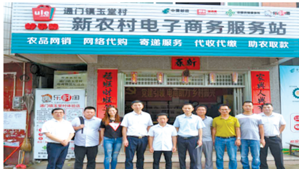
↑广东省邮政公司到玉堂村考察电商扶贫工作

美先无核黄皮饼、冲合蜂蜜、顺福无花果、冲枝笋干、云雾茶等郁南特产进行展销。玉堂村成为首个参加该博览会的贫困村，成功吸引了众多市民和客商围观咨询，《佛山日报》等媒体进行了多次报道，推动玉堂番石榴形成一定的品牌知名度。在2019年、2020年广东脱贫攻坚展及郁南黄皮节上，玉堂番石榴及其它优质农产品深受客户欢迎。2018年5月，玉堂村“新农村电子商务服务站”正式营业，贫困村从此拥有了电商实体平台，为“郁南第一家”。该服务站建成后交由贫困户经营，通过“农产品上网”“工业品下行”，深入发展电商，便民利民。在经营模式上，由玉堂农民种养专业合作社与中国邮政集团公司广东省郁南县分公司、郁南县供销社合作联社通力合作，依托郁南邮政公司“邮乐购”和郁南供销社“乐村淘”等两大农村电商平台开展经营，确保长期稳定。