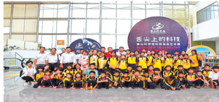
组织55名建档立卡学生参观佛山科技馆

让孩子们度过一个格外有意义的儿童节。对许多山区儿童来说，这是他们第一次走出山区，一睹大都市繁华的景象，亲身体会祖国的飞速发展。在科技馆展厅里，孩子们仿佛置身于知识的海洋，探索科技的奥秘、体验科技的神奇、感受科技力量的震撼，生动有趣、蕴含着人类智慧的各种展品，让孩子们目不暇接，流连忘返。新中国成立70周年前夕，佛山科技馆科