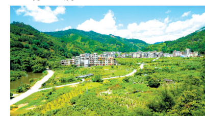
美丽的森林乡村——玉堂村

广大村民相信，在党的好政策引领下，玉堂村如期完成脱贫攻坚工作任务，将继续有序衔接乡村振兴，建设美丽新农村，玉堂必将金玉满堂。