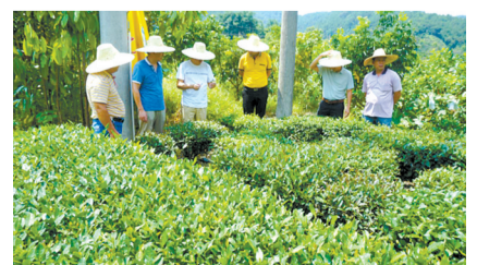
广东金骏康公司三位博士到村考察扶贫产业