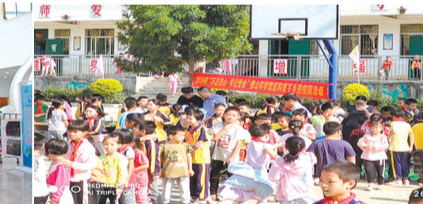
通门镇中心小学学生体验科普展项