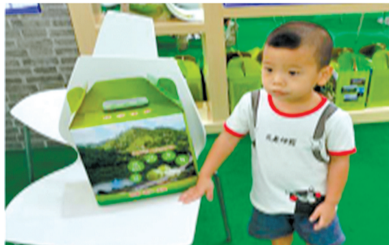
←玉堂番石榴参加广东脱贫攻坚展