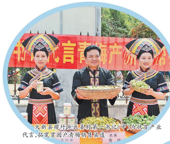
大新县榄圩乡武美村第一书记(中)为扶贫产业代言,拓宽贫困户青梅销售渠道。