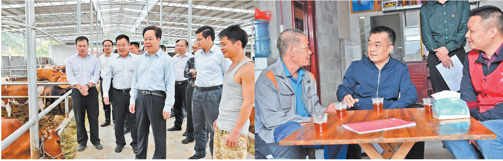
崇左市委书记刘有明(前中)在天等县天等镇安魁村冲锋牛合作社调研。