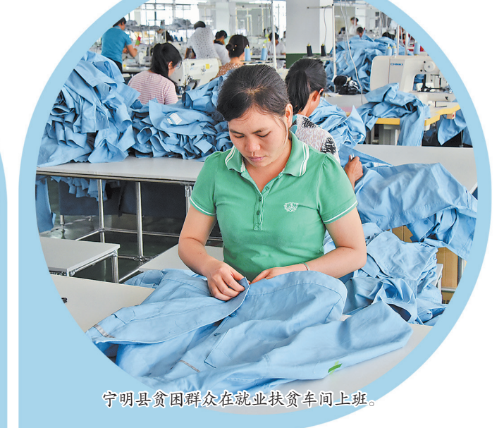
宁明县贫困群众在就业扶贫车间上班。