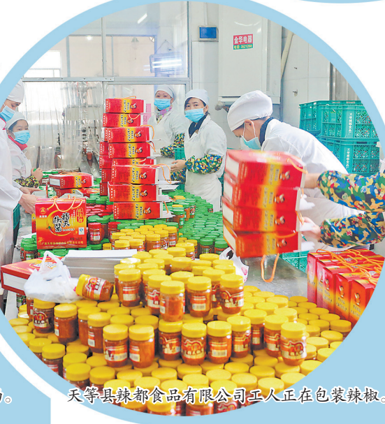
天等县辣都食品有限公司工人正在包装辣椒。