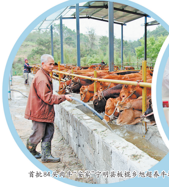
首批84头肉牛“安家”宁明县板棍乡旭超养牛场。