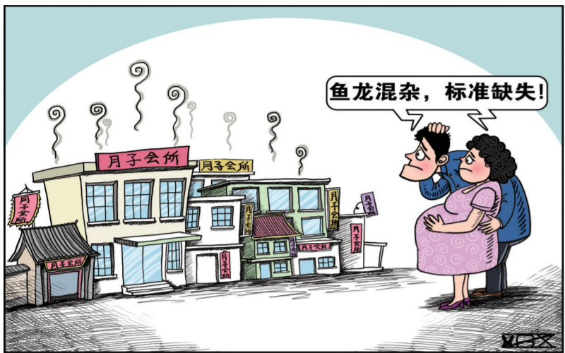
隐忧 (新华社发 翟桂溪 作)

随着80后独生子女一代逐步成为生育主体,以“月子会所”为代表的母婴健康护理社会化服务方兴未艾。在很多城市,月子会所市场炙手可热,广受追捧。 但是,在火热的景象之下,月子会所也因缺乏行业监管和规范标准而受到多方质疑,一些“作坊式”机构混迹其中等问题更加剧了行业发展隐忧。 猴年叠加二胎:月子会所迎“最好的时代”? “从去年11月开始,每天平均要接待3位妈妈前来咨询和探店,三居室和二居室基本上预订完毕。今年开春,房间几乎不够了。”咨询和预订火爆让杭州慈产后休养中心工作人员有些意外。作为杭州最高端的月子会所之一,其推出的三个套餐均价都在10万元以上,但这并未影响业务量出现明显增长。